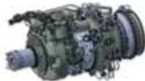
AÉRONEF PLUS PROPRE ET PLUS SILENCIEUX