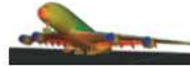
AÉRONEF NUMÉRIQUE Optimisation aérodynamique Gestion de mission intelligente Connectivité bord-sol