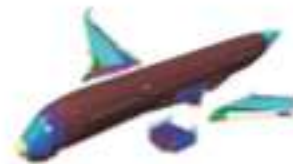
AÉRONEF COMPOSITE Réduction de la masse