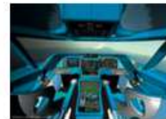
AÉRONEF PLUS ÉLECTRIQUE Gestion dynamique Réduction de la consommation